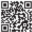
Video-Anleitung für die Sprachsteuerung